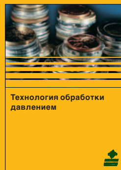
Технология обработки давлением