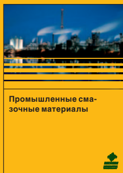
Промышленные смазочные материалы